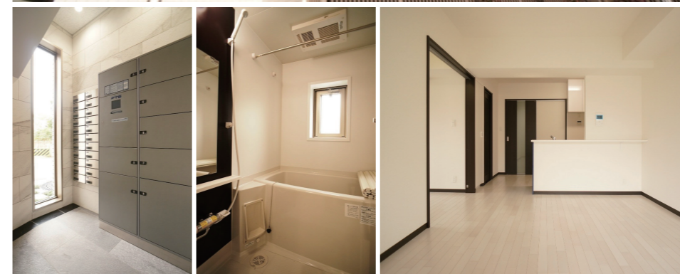
白を基調にした上質感あふれる外観。生活動線や設備など、暮らしやすさにも配慮。宅配ボックスは8年前の竣工時に導入したもので、先見の明を感じる。最上階には2LDKの自宅2戸を設けている