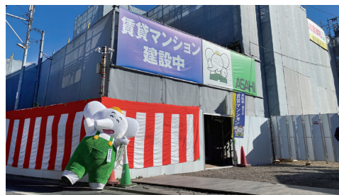
見学会は東京・神奈川で随時開催中。

朝日建設では高気密・高断熱建物の性能の高さを体感できる見学会を随時開催。常設の賃貸専門ショールームもあるので、一度足を運んでみてはいかがでしょうか。