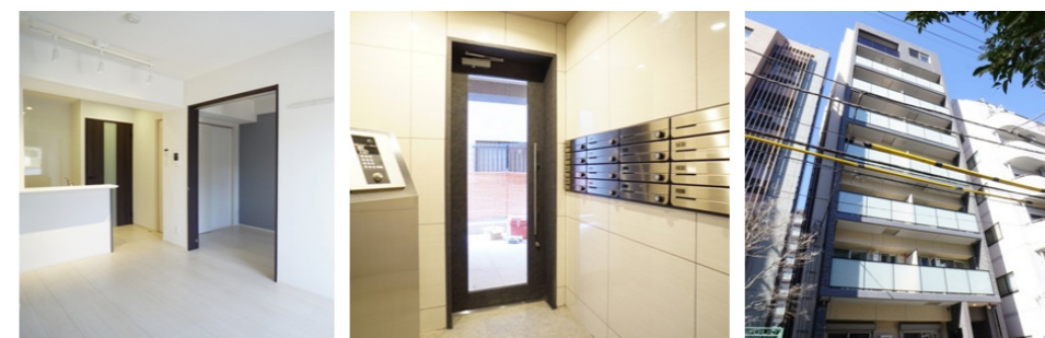
ベランダ手すりのパネルがアクセントになったスタイリッシュな外観。オートロックや宅配ボックス、エレベーターなど設備も充実。部屋は1LDKで3パターンのカラーを用意