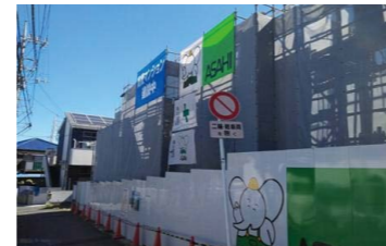
「朝日建設のキャラクター『やるぞうくん』が工事現場を親しみやすい雰囲気にしてくれました」と奥様

「依頼先は安心して任せられるか、信頼できる会社であるかが大事。朝日建設はこの先何十年も長い付き合いができる会社です」とOさんご夫妻