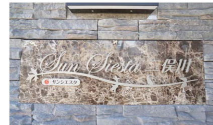
物件名はOさんが経営する会社名に因んだ「サンシエスタ」ブランド。社屋と同じ優しい色合いの外壁に

竣工：2021年12月 住所：神奈川県横浜市旭区 階数：地上4階 間取り：1K 敷地面積：384.93㎡ (116.44坪) 戸数：22戸 交通：相鉄線「二俣川」駅南口ロータリーより徒歩7分 主な設備：モニター付きオートロック、宅配ボックス、防犯カメラ、無料Wi-Fi、浴室乾燥、温水洗浄便座、IHキッチンヒーター、二重サッシ