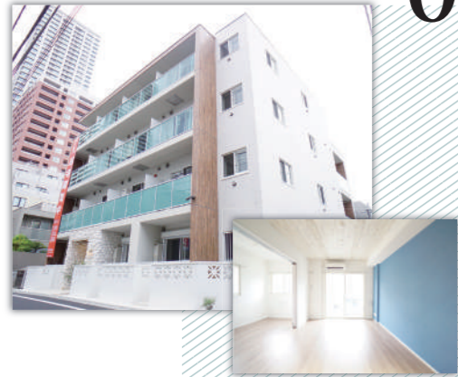
CREARE MUSASHIKOYAMA RESIDENCE PREMIUM (クレアーレ武蔵小山レジデンスプレミアム)