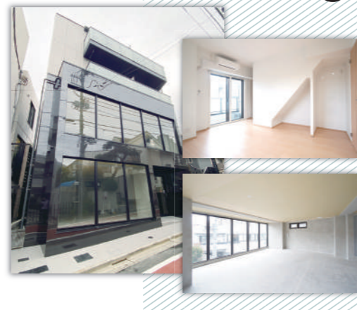
prendre aile (プランドール エール)