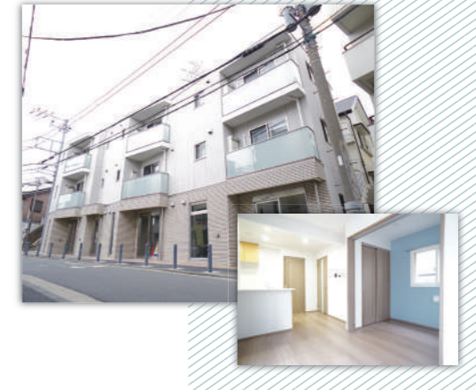
ラ・ビスタ・パークハウス片倉1