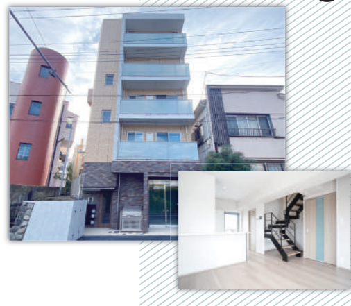
サン シエスタ鶴ヶ峰II