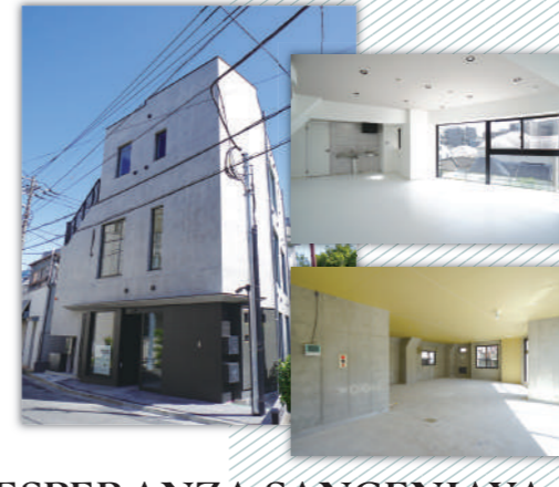
ESPERANZA SANGENJAYA annex (エスペランサ三軒茶屋アネックス)