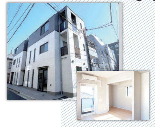
パサージュコート鷹番