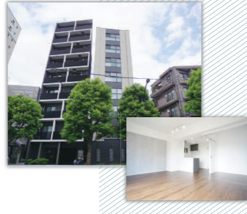
クレアーレ戸越銀座