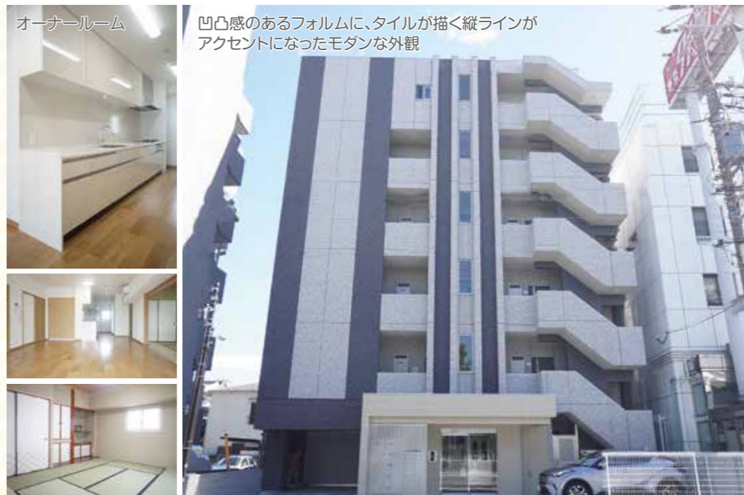
凹凸感のあるフォルムに、タイルが描く縦ラインがアクセントになったモダンな外観