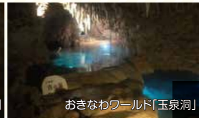
おきなわワールド「玉泉洞」