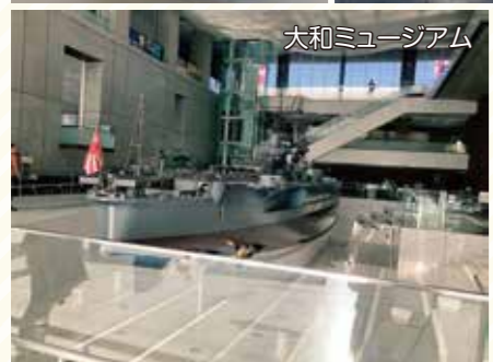
大和ミュージアム