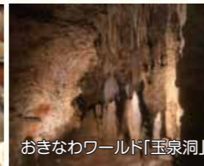
おきなわワールド「玉泉洞」