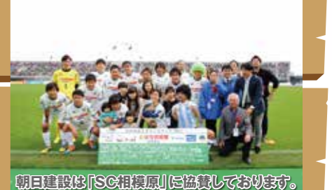
朝日建設は「SC相模原」に協賛しております。